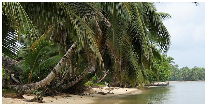
Auf der Insel Sainte Marie