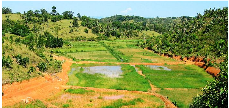
Vorbereitungen für den Aufbau der Fischzucht in der Nähe von Ankaramalaza, rechts: Reisfelder